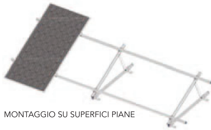
MONTAGGIO SU SUPERFICI PIANE

La gamma dei profilati ed accessori potrà essere ampliata in funzione di eventuali richieste specifiche del cliente per progetti speciali.